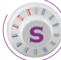
Facile selezione punti