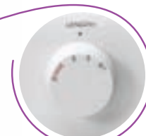
Regolazione lunghezza punto