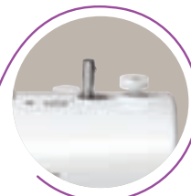
Avvolgi bobina automatico