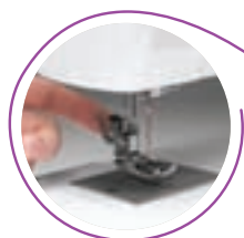
Piedini a sgancio rapido