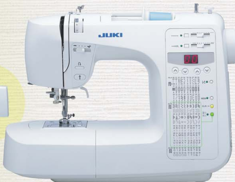
Vaiiletta rigida in plastica

Un' ampia gamma di punti disponibili per soddisfare ogni tua esigenza di cucitura.