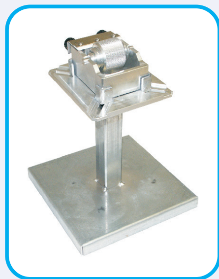
Tingibordo manuale cod. 705BA00000TGBA