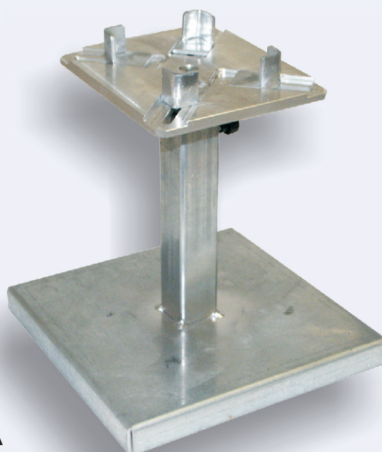
Supporto per tingibordo cod. 705BA00000PTGBA

Vaschetta tingibordo in alluminio per la rapida e precisa applicazione manuale della vernice sui bordi dei manufatti.