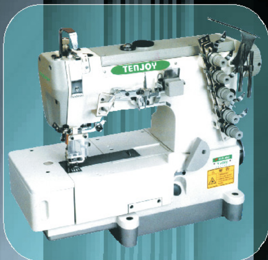
mod. TJ500-01CB cod. 360 (Testa 3 aghi piana)