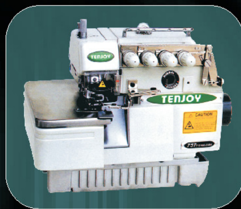
mod. TJ757F-516M2-35 cod. 480 (2 aghi, 5 fili)