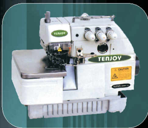
mod. TJ737F-504M2 cod. 440 (1 ago, 3 fili)