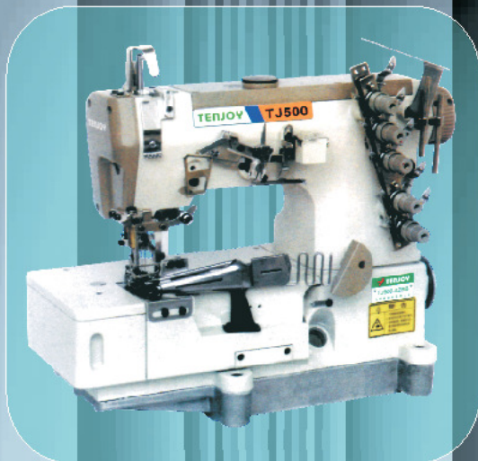
mod. TJ500-02BB cod. 380 (Testa 3 aghi per collare)