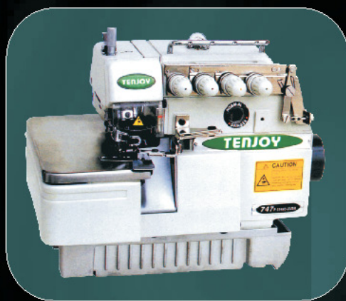
mod. TJ747F-514M2-24/LFC-2 cod. 460 (2 aghi, 4 fili)